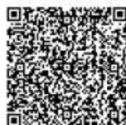
水利工程项目验收