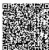
生产建设项目水土保持方案审批

②网上办：抚顺政务服务网： https://zwfw.fushun.gov.cn/fszww/epointzwmhwz/pages/legal/personaleventdetail?taskguid=9eeca312-58c4-42da-9a32-62134651b320