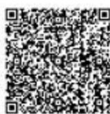
城市建设填堵水域、废除围堤审核