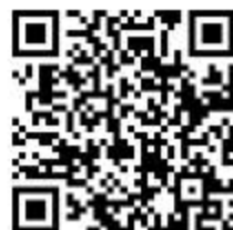
容缺办理事项清单