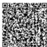
水工程建设规划同意书审核

②网上办：抚顺政务服务网： https://zwfw.fushun.gov.cn/fszww/epointzwmhwz/pages/legal/personaleventdetail?taskguid=d31d95ad-5de9-46e4-a939-cd4fca88b343