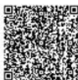
水库大坝降等、报废的审 定

v.cn/fszww/epointzwmhwz/pages/legal/personaleventdetail?taskguid=68ebc9e2-0a1d-40f0-b131-f15969d97b8f