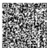
河道管理范围内有关活动 (不含河道采砂) 审批

②网上办：抚顺政务服务网： https://zwfw.fushun.gov.cn/fszww/epointzwmhwz/pages/legal/personaleventdetail?taskguid=1a079602-4f03-4fd2-ba19-3258201d372d