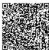
征占湖泊、河流、库塘湿地审核

②网上办：抚顺政务服务网： https://zwfw.fushun.gov.cn/fszww/epointzwmhwz/pages/legal/personaleventdetail?taskguid=15aedb2a-3f30-4d09-b5aa-ce785e51b9ba