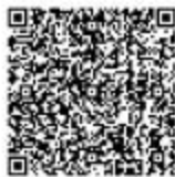
水利基建项目初步设计文件审批