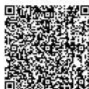
水土流失危害确认

ntdetail?taskguid=bfc74167-ecf0-4f6e-a918-aba74b5b3004