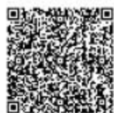
占用农业灌溉水源、灌排 工程设施审批

②网上办：抚顺政务服务网： https://zwfw.fushun.gov.cn/fszww/epointzwmhwz/pages/legal/personaleventdetail?taskguid=8c283c27-05e4-4dad-89e6-5170489d886f